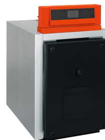
Водогрейный котел Vitomax LCB, мощностью от 150 до 620 кВт