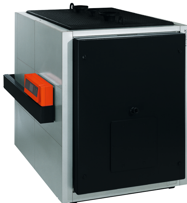
Котел Vitomax LCB с номинальной тепловой мощностью от 780 до 2000 кВт

Проверенное качество промышленных котлов Vitomax LCB мощностью до 2000 кВт для жидкого топлива и газа с высоким нормативным коэффициентом использования.