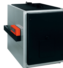
Водогрейный котел Vitomax LCB, мощностью от 780 до 2000 кВт