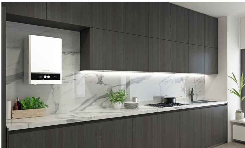
Настенные котлы COPA Eomix с приятным для глаза современным дизайном

Компактные и эффективные настенные конденсационные газовые котлы с привлекательным соотношением цены и эффективности