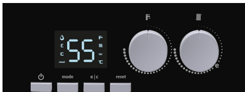
Удобный цифровой ЖК-дисплей со светодиодной подсветкой