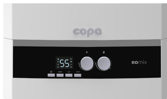
Эко-режим (эффективный режим) и комфортный режим (режим быстрого нагрева) можно настроить с панели управления с помощью кнопок E/C.

В случае возникновения нештатной ситуации пользователь всегда получит оперативное сообщение.