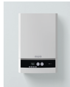
Еomix, газовый настенный конденсационный котел

Иные данные о номинальной тепловой мощности при работе котла на сжиженном газе или об эксплуатации котла в многофункциональном режиме – см. Руководство по планированию