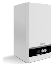
Еomix, газовый настенный конденсационный котел