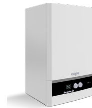
Еomix, газовый настенный конденсационный котел