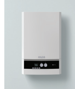
Еomix, газовый настенный конденсационный котел

Иные данные о номинальной тепловой мощности при работе котла на сжиженном газе или об эксплуатации котла в многофункциональном режиме – см. Инструкцию по эксплуатации